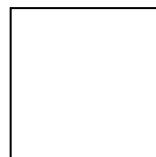
本會負責人印鑑章